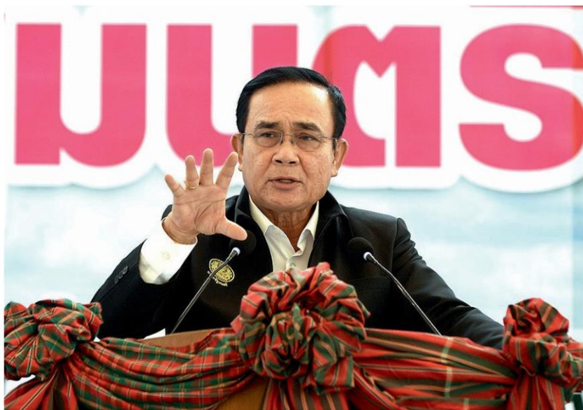
เปิดโรงอบข้าว - พล.อ.ประยุทธ์ จันทร์โอชา นายกรัฐมนตรีและ รว.กลาโหม เป็นประธานพิธีเปิดอาคารโรงคลุมชุดสูบน้ำเปลือก กลุ่มวิสาหกิจชุมชนศูนย์ข้าวชุมชนบ้านอุ่มแสง ต.คู อ.ราษฎร์ไศล จ.ศรีสะเกษ เมื่อวันที่ 7 พฤศจิกายน

“การหาแหล่งน้ำให้กับประชาชนรัฐพยายามที่จะดูแลเพื่อให้เกิดผลกระทบน้อยที่สุด ไม่ว่าจะเป็นการสร้างอ่างเก็บน้ำ หรือการสร้างเขื่อน ก็พร้อมที่จะทำแต่ก็ทำได้เพราะ