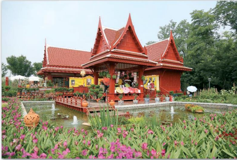
ภาพโดย หลี เชิงชุย